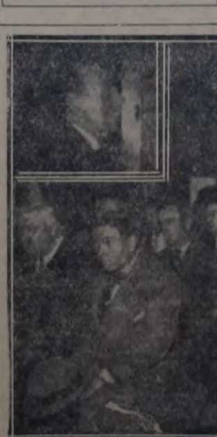
PUBLICO QUE ASISTIÓ A LA CONFERENCIA DADA EL SABADO 12 EN EL CENTRO SOCIALISTA DE LA SECCIÓN 6a. por el doctor Nicolás Repetto, sobre el tema "El país reclama medidas urgentes".