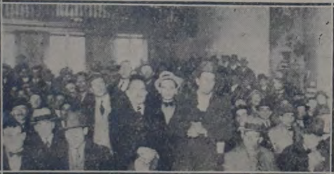
CONCURRENCIA A LA ASAMBLEA REALIZADA POR LA ASOCIACION TRABAJADORES DEL ESTADO

nabá totalmente el salón de la calle México 2070, se interesó vivamente por el asunto en discusión, en el cual intervinieron numerosos oradores.