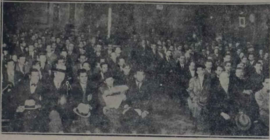
ASPECTO QUE OFRECÍA EL SALON DE LA CASA SUIZA

1o. Notificar a los industriales que vencidas las 48 horas, a contar del lunes 14 del corriente, los personales de las ramas: linotipo, tipografía, estereotipia, fundición de tipo, tipografía, rotogravado, aerografía y bronceado, paralizarán el trabajo en todas aquellas casas que no abonon a los obreros de dichas ramas el salario íntegro equi-