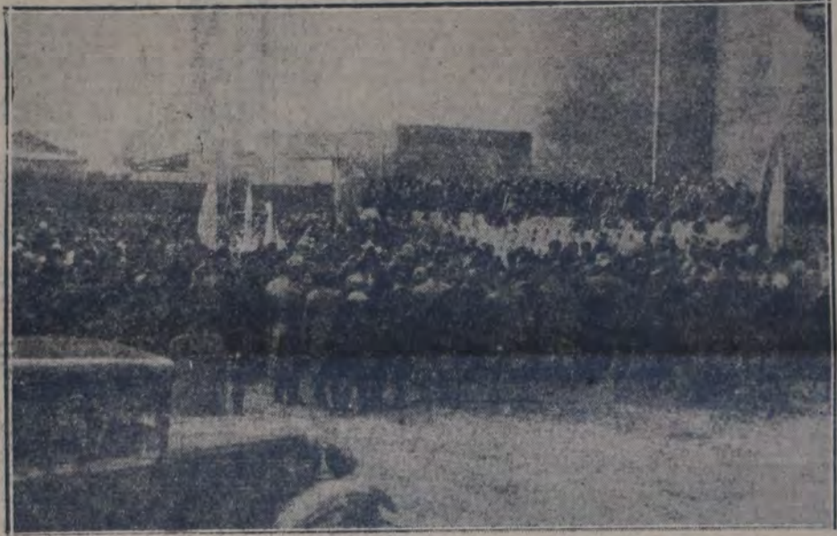
PARTE DEL PUBLICO QUE ASISTIO AYER A LA INAUGURACION DEL ELEVADOR DE GRANOS, EN Leones (Córdoba), en el momento de pronunciarse los discursos. Damos por separado la información noticiosa